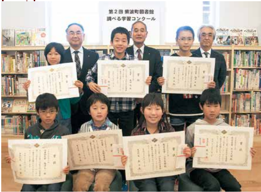
賞状を手に、喜びの笑顔を見せる子どもたち

第2回「紫波町図書館調べる学習コンクール」の表彰式は12月3日、図書館で開催されました。このコンクールは、子どもたちが自ら課題を発見し、その課題を解決する力を身に付けるきっかけにしてみようという企画したもの。今回は、町内外の小学生から40点の作品が寄せられ、審査の結果、次の皆さんが入賞者に決まりました。また、町長賞を受賞した作品のうち、2作品は全国コンクールに出品されます。